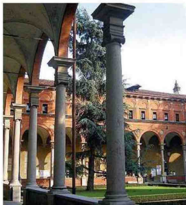
Uno scorcio dell'Università

L'Ateneo soffia sulle candeline Sono cent'anni, ma portati davvero bene Uno spazio ancora attuale per progettare