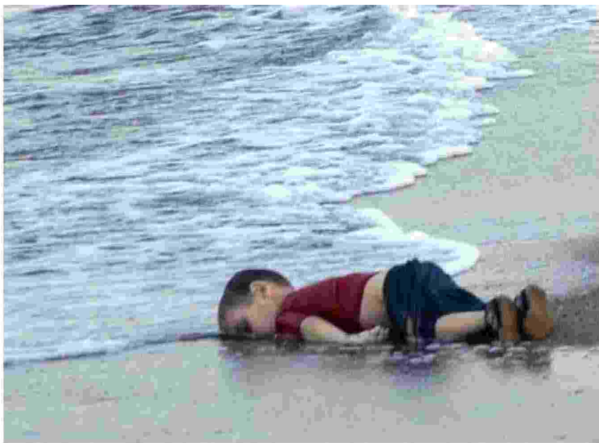
La foto di Alan Kurdi scattata dalla giornalista turca Nilüfer Demir, il 2 settembre 2015

Una immagine può dividere ma non ci lascia indifferenti E la pietà può renderci persone migliori