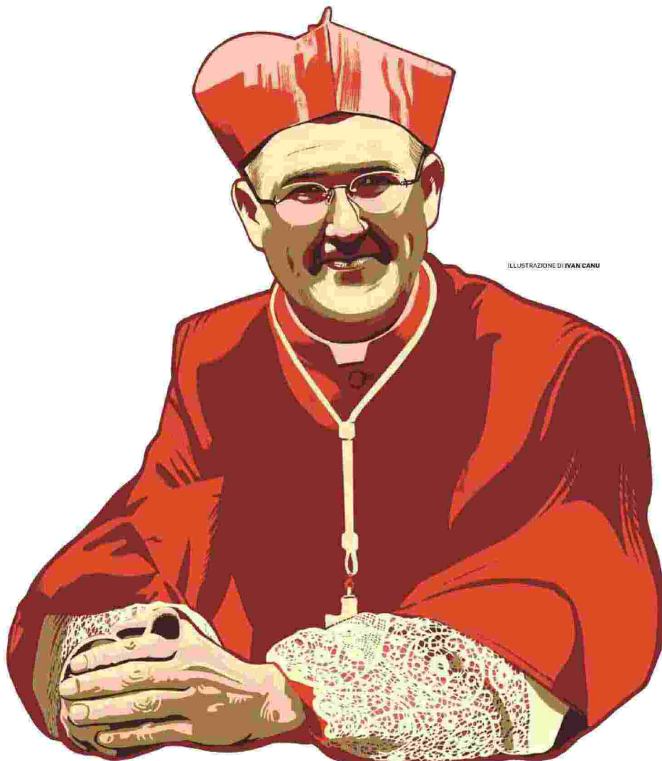
ILLUSTRAZIONE DI IVAN CANU

José Tolentino de Mendonça, nato sull'isola di Madeira, in Portogallo, nel 1965, è prefetto del dicastero per la cultura e l'educazione del Vaticano. È autore di vari libri, fra cui Metamorfosi necessaria . Rileggere San Paolo e La mistica dell'istante. Tempo e promessa (Vita e Pensiero)