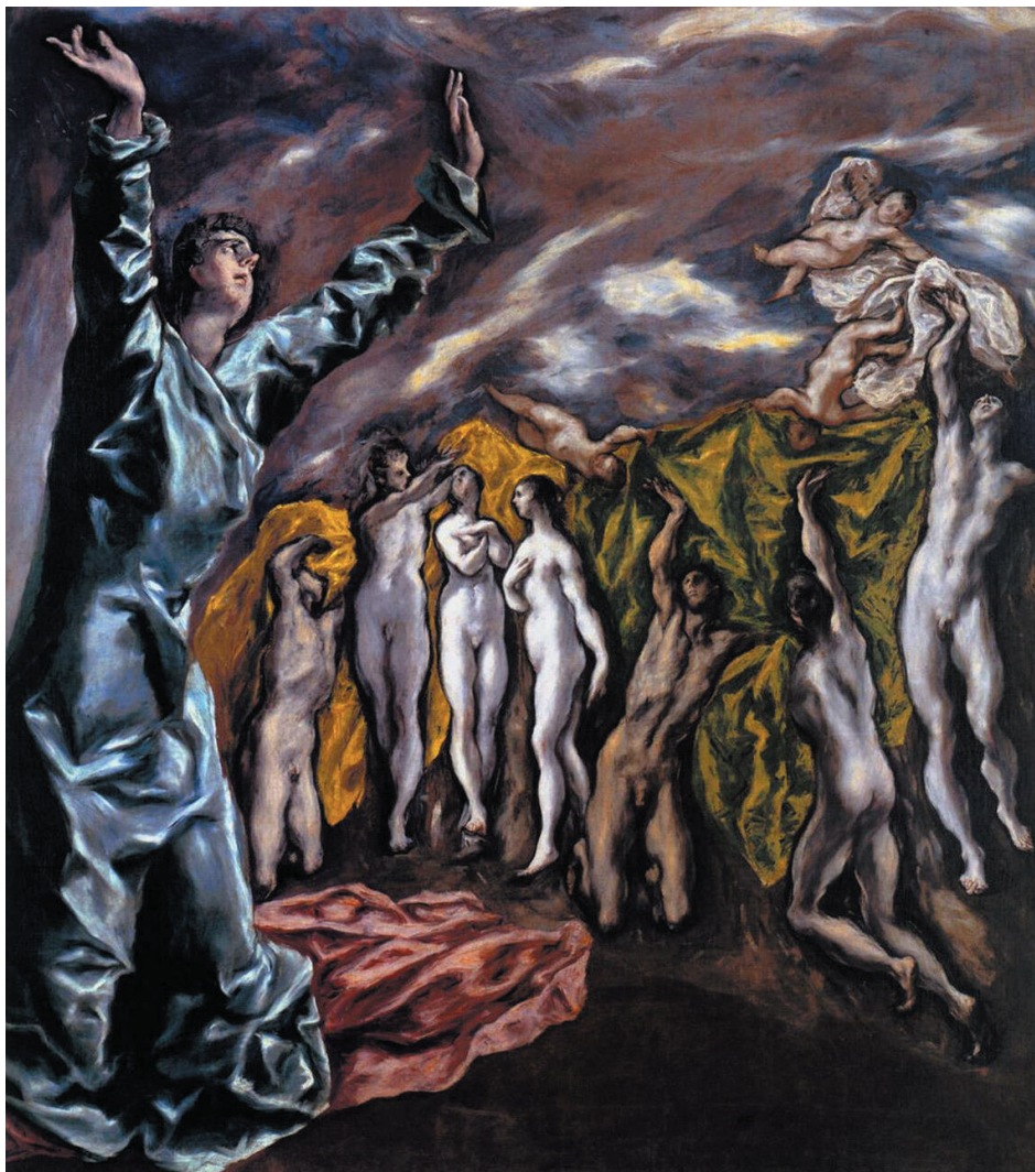
Il dipinto "L'apertura del Quinto sigillo" di El Greco (1541-1614) rappresenta la visione apocalittica di San Giovanni nell'ultimo libro del Nuovo Testamento

Ritaglio stampa ad uso esclusivo del destinatario, non riproducibile.