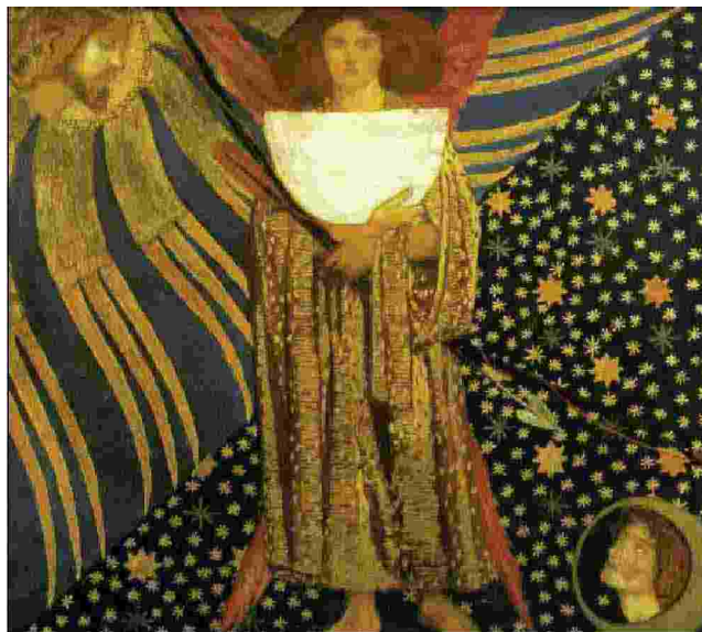
Dante Gabriele Rossetti, «Dantis Amor» (1860)

Chi ha avuto il privilegio della sua amicizia sa che egli preferirebbe essere ricordato così, in quell'anelito senza risposta: «Mostrati infine. / Non inviarmi più / alcun messaggero. / Non sanno dirmi ciò che voglio».