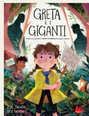
Greta e i giganti di Zoë Tucker e Zoë Persico

Vita e Pensiero - 13€ (ebook disponibile)