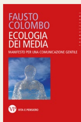
Ecologia dei media di Fausto Colombo

"I media sono come la plastica, una fantastica invenzione, che usata irresponsabilmente inquina". Si basa su questa similitudine il nuovo saggio del sociologo Fausto Colombo. Proprio come quando si parla di ambiente, anche il discorso sui media non può più ignorare i problemi di "inquinamento" del linguaggio e dell'universo simbolico. Colombo ci spiega, dunque, in che termini è possibile parlare di "ecologia" dei media e stila un "manifesto della comunicazione gentile", per tornare a una comunicazione "umana" basata sul riconoscimento dell'altro.