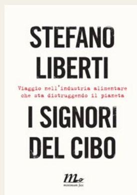
I signori del cibo di Stefano Liberti

Consigli di lettura di tutti i generi, per nutrire anche la mente